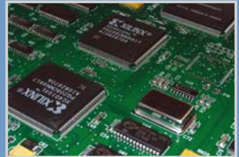
Manejo de PCB

NOTA: X = 0 → MATRIX 200™ Versiones Estándar, X = 1 → MATRIX 200™ Versión con seguridad ESD, X = 2 → MATRIX 200™ Seguridad ESD + YAG Filtro de Corte.