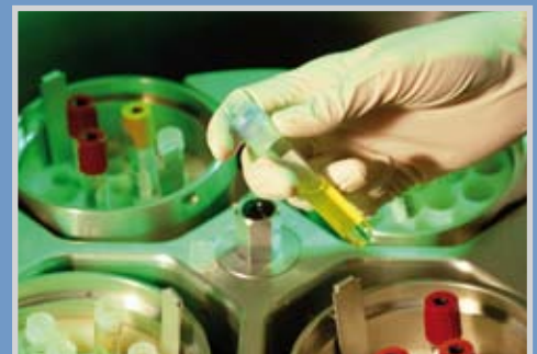
Médicas y farmacéuticas