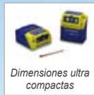
Dimensiones ultra compactas

Su fuerte construcción, clase protectora IP65, temperatura operativa máxima de 50° C y suministro eléctrico de 10 a 30 VDC, hacen del Matrix 200™ el producto ideal para aplicaciones industriales.